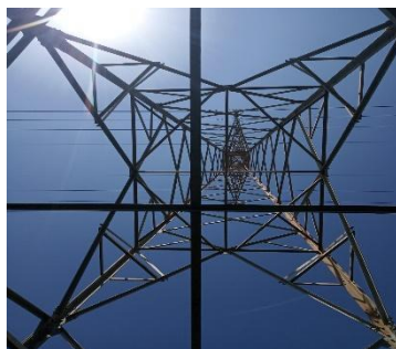
Alba Martín “Figuras en las alturas”