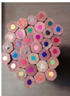
"Hexágonos de colores"