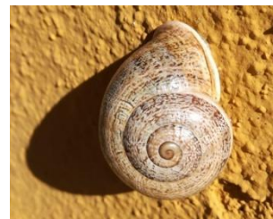
“Vida de Espirales” Bruno Sánchez